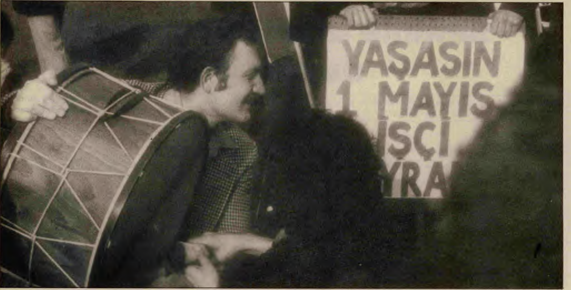
Yaşam öyküsü de ne yazık ki yarım kaldı